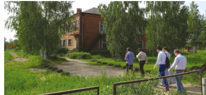
Рис. 1. Поездка в музей с. Поречье-Рыбное, июнь 2014 г. Fig. 1. Visit to the Poreche museum, June 2014

При условии реализации всех возможностей, через несколько лет, благодаря сельскому туризму, Поречье-Рыбное СМОЖЕТ снова стать процветающим, оживленным местом.