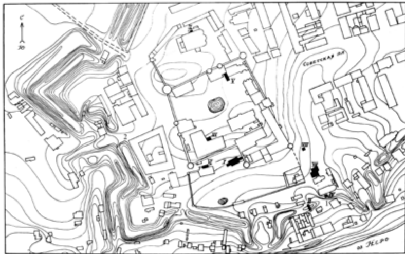
Схема из отчёта Н. Н. Воронина за 1956 г. с нанесением дополнительной информации: 1 – раскоп № 5 О. М. Иоаннисяна 1987 – 1994 гг.; 2 – раскоп А. Е. Леонтьева, 1999 г.

м соответственно 2 . Н. Н. Воронин впервые предположил, что для сооружения крепости использовался культурный слой города. Это предположение полностью подтвердилось данными раскопа 2, целью которого была полная прорезка вала и нижележащего культурного слоя.