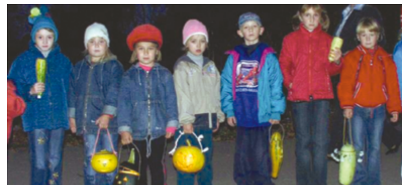
Рис. 3. Дети Поречья-Рыбного с фонариками из свёклы и тыкв в руках, день св. вмч. Никиты, 2005 г. Fig. 3. Children from Poreche-Rybnoye carrying lanterns of beets and pumpkins on St. Nikita's day, 2005