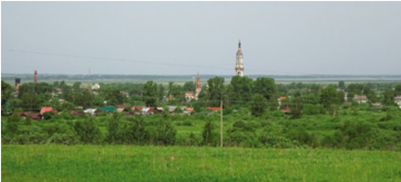
Рис. 5. Вид на Поречье-Рыбное издалека – выделяется высокая колокольня, зелёное село кажется тихим и умиротворённым. Fig. 5. Poreche-Rybnoye from a distance - the high bell-tower dominates the view, the village looks green, quiet and peaceful