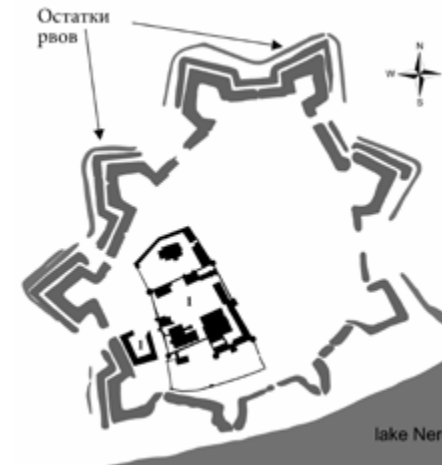
Схема крепости, созданная на основе современной топографической карты г. Ростова (М 1:500). Цифрой «1» обозначен ансамбль Ростовского кремля.

1. Необходимо провести сплошное обследование крепости. Составить план с обозначением сохранившихся, повреждённых и утраченных участков вала и рва и наконец ответить на во-