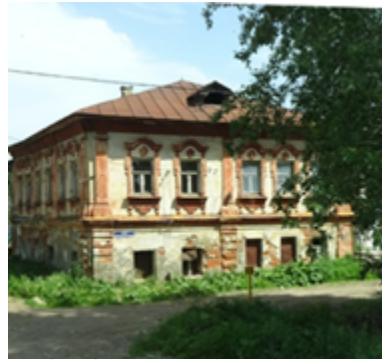
Рис. 4. Постройки городского типа в д. Вризенвеен (слева) и с. Поречье (справа); успешные торговцы из этих поселений по завершении своей карьеры возводили первоклассные дома. Fig. 4. Urban-like houses in Vriezenveen (left) and Poreche (right); traders from those villages who made their fortune, built high-class houses when they retired