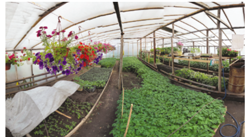
В теплице. 2013 г.