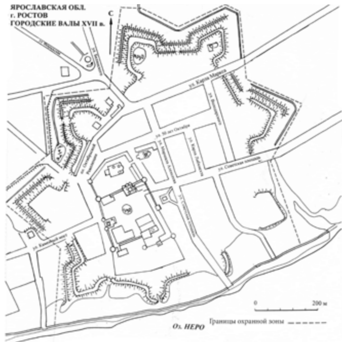
Схема объекта культурного наследия федерального значения «Городские валы XVII в.» из паспорта на памятник, 2006 г.

Таким образом, на сегодняшний день нет детального плана с обозначением всех сохранившихся участков вала и рва. На современной топографической карте М 1:500 (в 1 см 5 м), хранящейся в администрации города, вал и ров земляной крепости обозначены. Показаны гребни валов, внутренние и внешние склоны, отметки высот по Балтийской системе. Эта карта может стать хорошей подосновой для будущих исследований крепости.