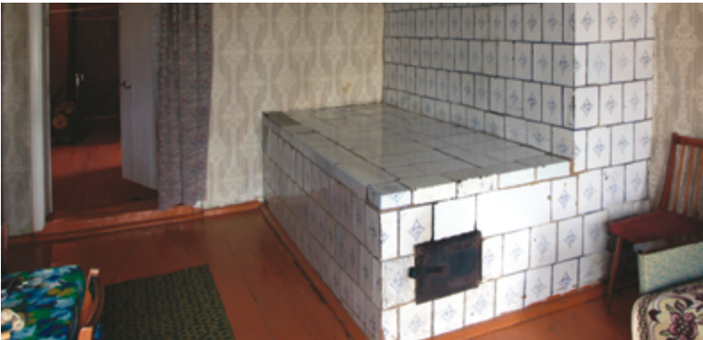
Изразцовая лежанка в поречском каменном доме, 2012.

Торговое огородничество – знаменитый промысел, ресурс Ростовской земли и Поречья в частности. Выдающиеся качества почв: пойменных – прибрежных и чернозёмных – как низинных, так и возвышенных, сочетание высокой плотности населения, аграрного перенаселения Ростовского уезда, его выгодного экономико-географического положения и подходящих природно-климатических условий способствовали в XVIII – XIX вв. в данном районе интенсификации земледелия, возникновению разнообразных промыслов и развитию торгового огородничества.