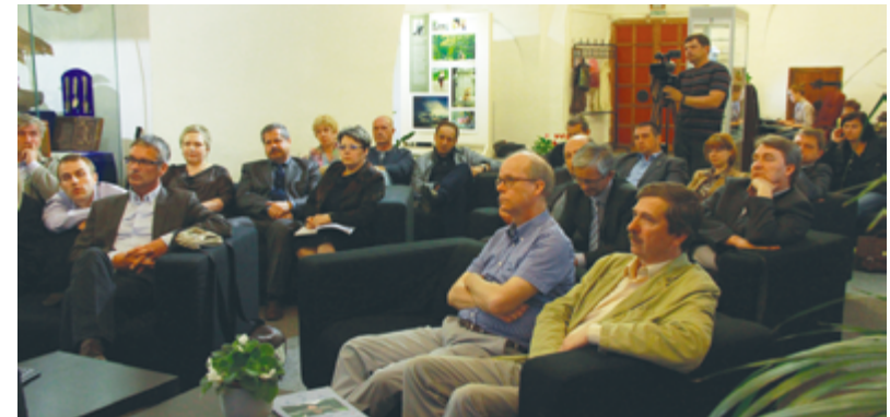
Conference of 2013 – 2014. Rostov-Veliky Конференции 2013 – 2014 гг. Ростов Великий

The group of Russian specialists visited the following sites: fortresses as museums in Naarden and Heusden, fortified city of Brielle, Vriezenveen – many agricultural families moved from this town to St Petersburg in the 18th century.