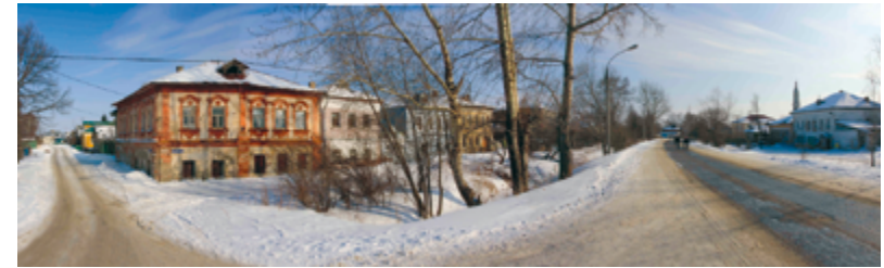
Улицы Поречья Вейка (Центральная) – справа и Березово (Чкалова) – слева. 2012 г.