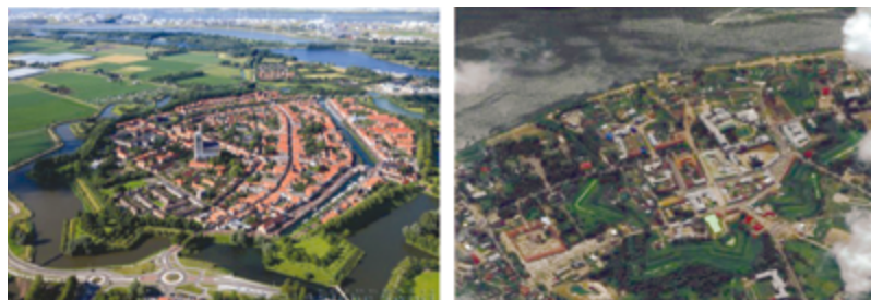
Город-крепость Бриль (Нидерланды)