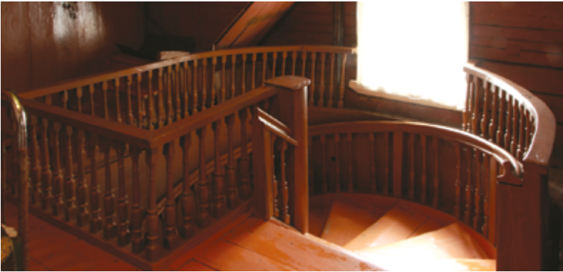
Винтовая лестница на 2-й этаж в поречском каменном доме, 2012 г.