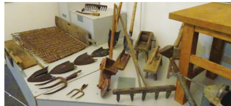
Рис. 2. Сельскохозяйственные инструменты (из с. Поречье-Рыбное) на выставке в музее «Ростовский кремль», июнь 2014 г. Fig. 2. Agricultural instruments (from Poreche) in an exhibition in the Rostov Kremlin Museum, June 2014