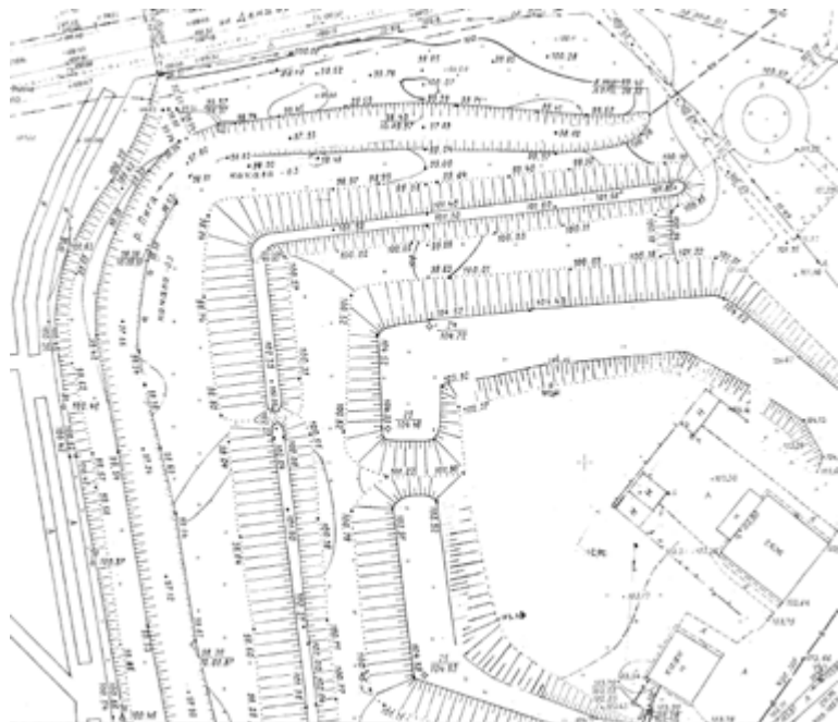
Фрагмент современной топографической карты г. Ростова (М 1:500) с обозначением участка крепости

отчёт 9 , который содержит массу неверных датировок и интерпретаций. Анализ отчёта планируется посвятить специальное исследование.