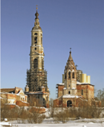
Храмовый комплекс с запада, 2012 г.