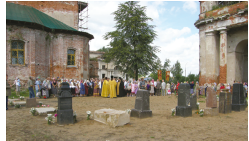
Крестный ход в престольный праздник Петра и Павла. 2007 г.