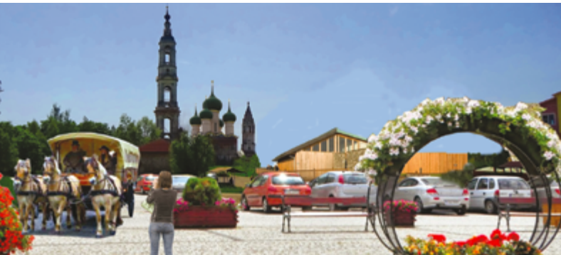
Поречье-Рыбное в будущем Poreche-Rybnoye in the future